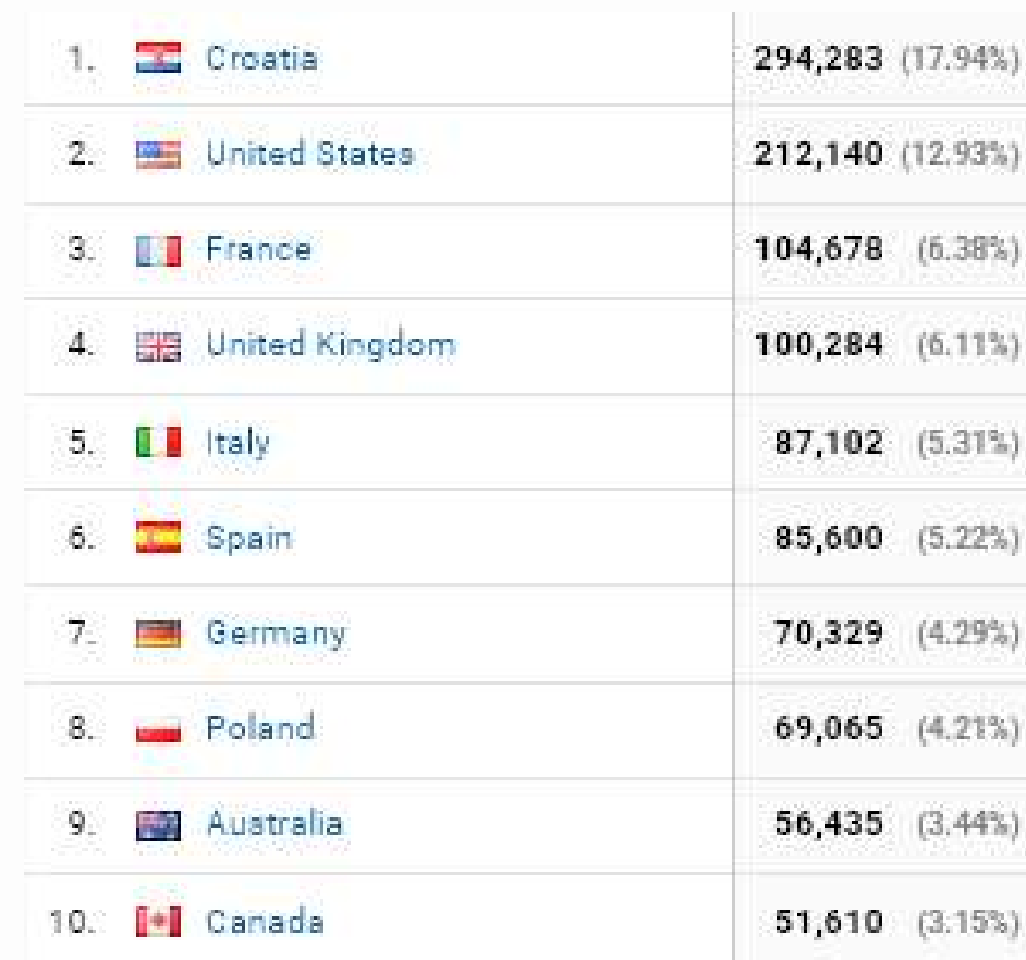
TCN portal - Google Analytics